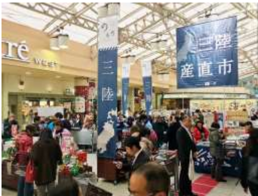
のもの 三陸産直市in上野駅

「販路開拓・商品開発セミナー」を実施し、その後、少人数制のワークショップや個別指導、展示会等への出展支援を実施。