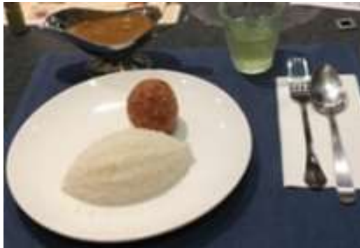
レトルト食品の盛り付け例

新規の販路開拓のため、ハラル認証取得を支援。 製品化及びマレーシアでのテスト販売を実施。