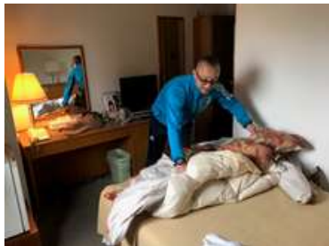
ビジネスホテル実地研修

ホテルの概要設計、オペレーションポリシー策定、組織づくり等のソフト面の支援を実施。