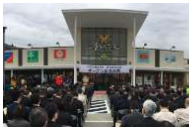
商業施設「アバッセたかた」

商業施設「アバッセたかた」の開業にあたって、営業規則の策定や販売促進のイベント開催等について支援を実施。