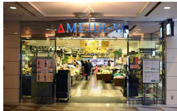
タイプ3 域外市場進出