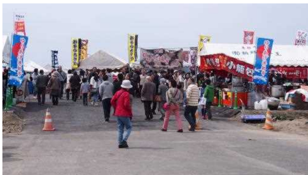
タイプ2 域内需要型