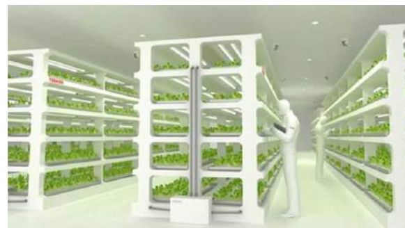
タイプ4 設備投資型