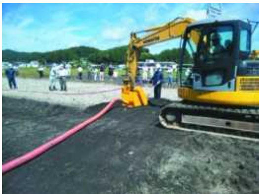
タイプ1 復旧ステージ