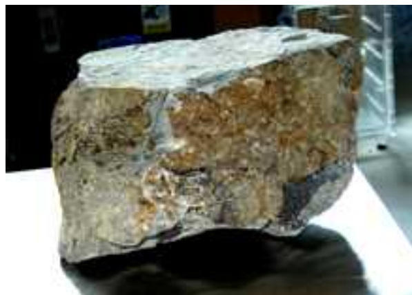
砥山石 (汚染されてしまった)

支援先: 大堀相馬焼協同組合、福島県ハイテクプラザ テーマ: 大堀相馬焼の青ひび釉の代替材料開発