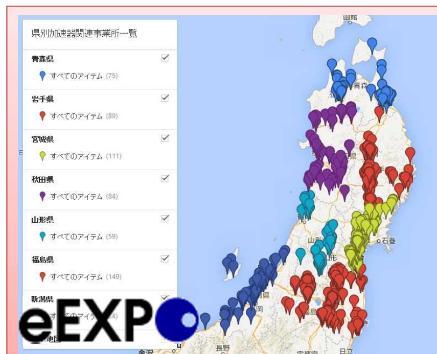
加速器関連の要素技術を持つ企業マップ リストアップ

・ILC、東北放射光の誘致を踏まえ、加速器関連産業の要素技術を分析。東北7県で約650社をリストアップ。eEXPOへの登録を推進中。KEK研究者とのマッチングも実施。9月にコーディネーターチームを組成。