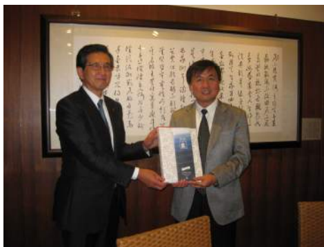
台湾工業技術院の徐院長